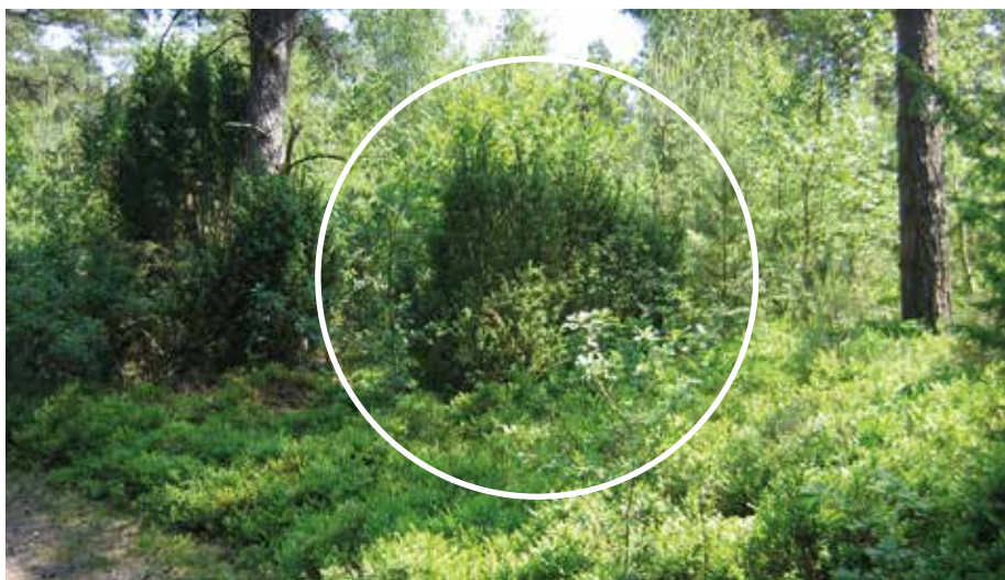
Wegkwijnende jeneverbes in het bos