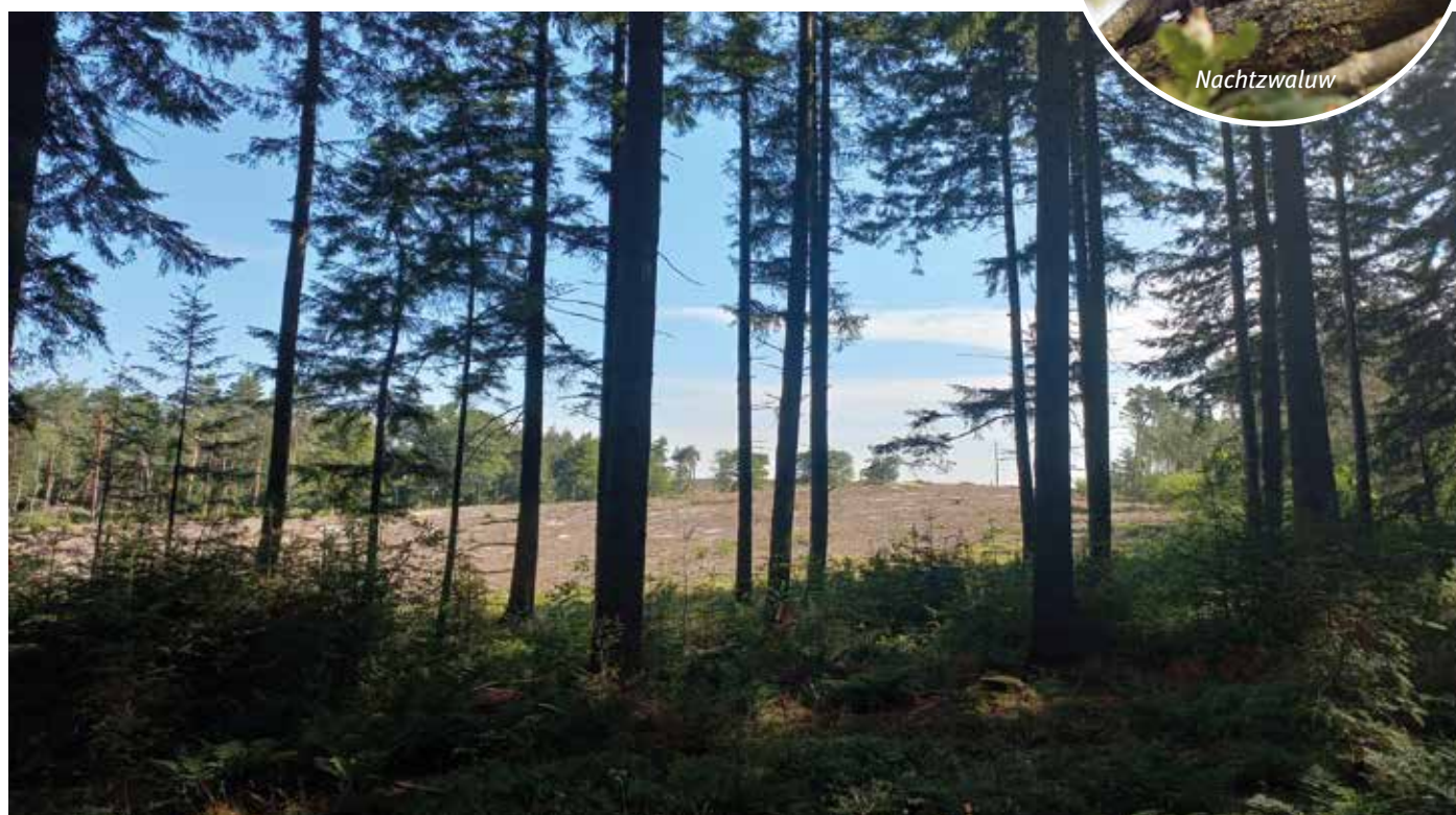
Zicht op berg door het bos