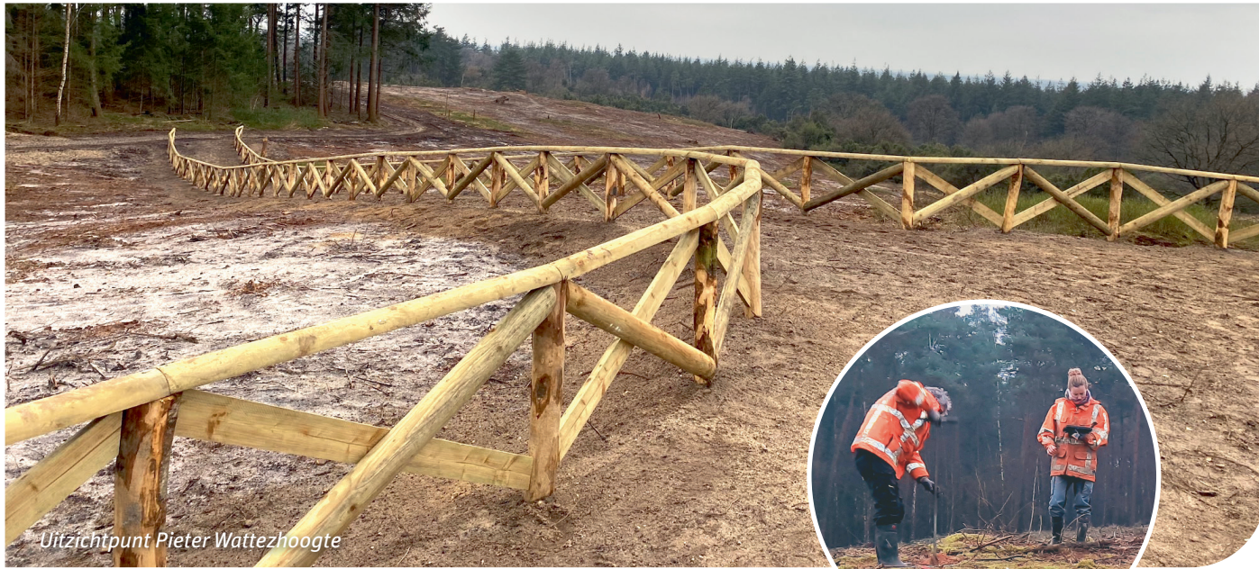
Uitzichtpunt Pieter Watzehoogte