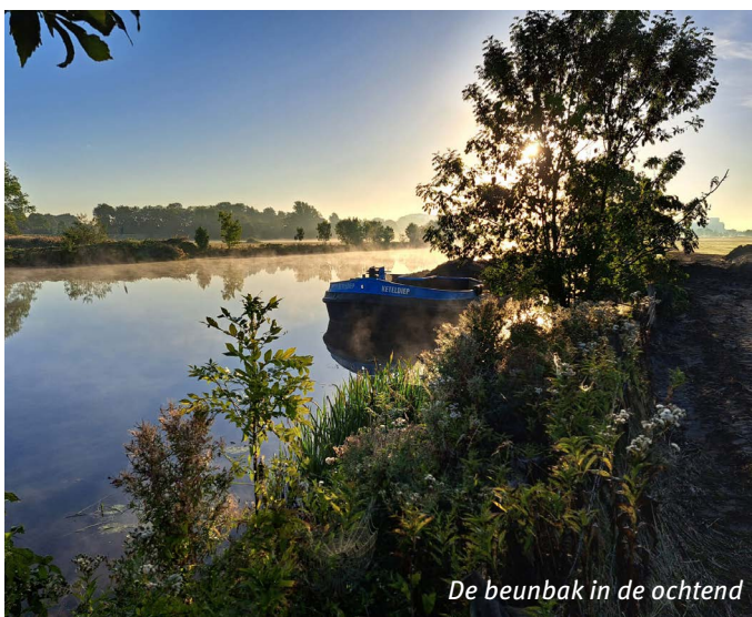
De beunbak in de ochtend

Vanaf eind augustus '22 ging aannemingsbedrijf Netjes BV aan de slag met het uitgraven van twee soms wel 10 meter brede slenken in de Spijkpolder. De slenken lopen min of meer parallel en volgen deels de oude Vecht meanders. Door ze weer aan te sluiten op de Vecht, ontstaat een landschap wat regelmatig en makkelijk kan overstromen. Juist hierdoor kan het kievitsbloemhooiland zich goed ontwikkelen. Bovendien vormt het nu een goed voortplantingsgebied voor de kwabaal en grote modderkruiper. De jonge vissen zijn weer voedsel voor de zwarte sterns die over het water scheren en voor de schuchtere roerdampen in de rietkragen. Bij het